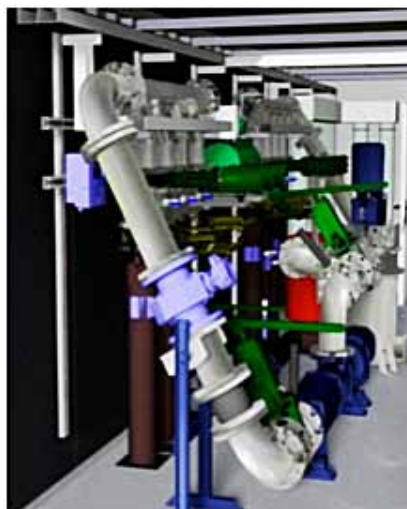
Von der Planung ...